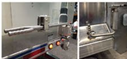
Pestillo lateral mecánico