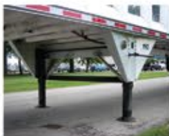
Ahorre peso con las carretillas de montaje inverso