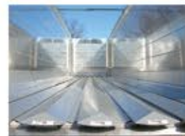
Piso en V