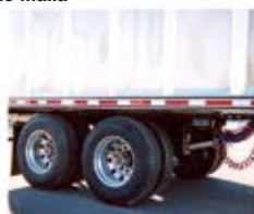
Suspensión neumática deslizable