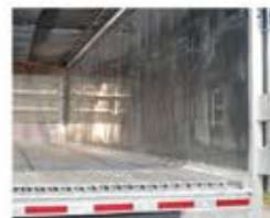
Opción de revestimiento de pared lateral interior completo