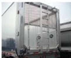
Compuerta de flujo de aire dividido: combinación sólida y de malla