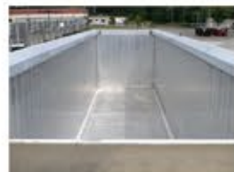
Riel superior bajo