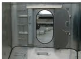
Puerta de inspección MAC