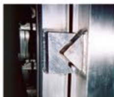
Bloque en V de la compuerta trasera