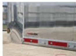
Panel lateral liso MACLOCK "MVP"