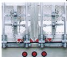
Bloqueos de leva cuádruple