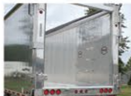
Compuerta de flujo de aire