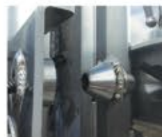
Puerta en puerta: cono y casquillo