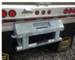
Parachoques trasero con ganchos de remolque